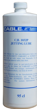
Jetting Lube Lubrifiant améliorant les performances duJetting Pour tubes Ø ext. 20.0 à 50.0 mm