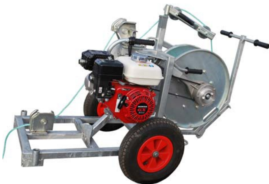
Châssis pour treuil PCW4 Pour utiliser le treuil comme treuil auxiliaire léger

Spécifications sous réserve de modifications — Photos non contractuelles